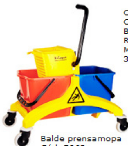
Balde prensamopa Cód. 7962