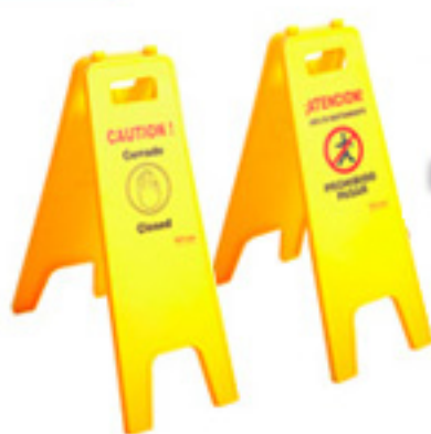
Señales Piso mojado, no pasar

Carro funcional con ruedas y bolsa con capacidad de 85 Lts. Medidas: 122 x 46,5 x 98 cm