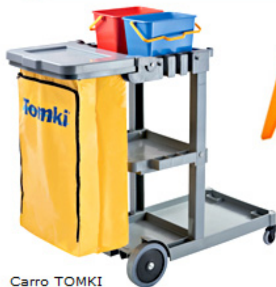
Carro TOMKI Cod. 1021

Con organizador 0,74 x 0,52 x 1,10 m. Peso kg: 9,50