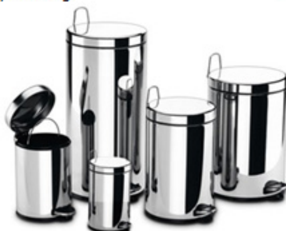
Cestos a pedal de acero inoxidable x 3 Lts. x 5 Lts. x 12 Lts. x 20 Lts.

Nuestra atención personalizada y asesoramiento profesional son la clave para la apertura, equipamiento integral y reposición de su emprendimiento hotelero y/o gastronómico.