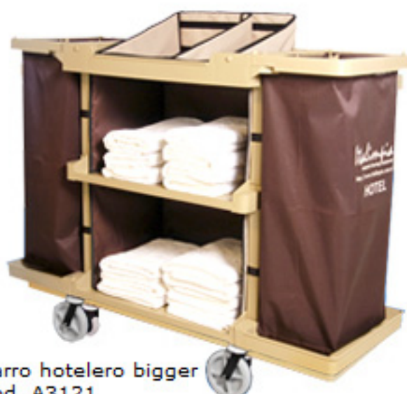
Carro hotelero bigger Cod. A3121