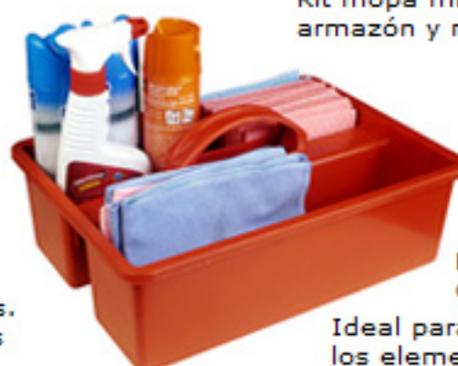
Bandeja Portaobjetos Cód. 3635

Ideal para llevar organizados los elementos de limpieza