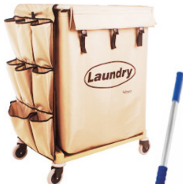
Carro de lavandería y portasabanas Laundry Cod. 3117

Con organizador 0,74 x 0,52 x 1,10 m. Peso kg: 9,50