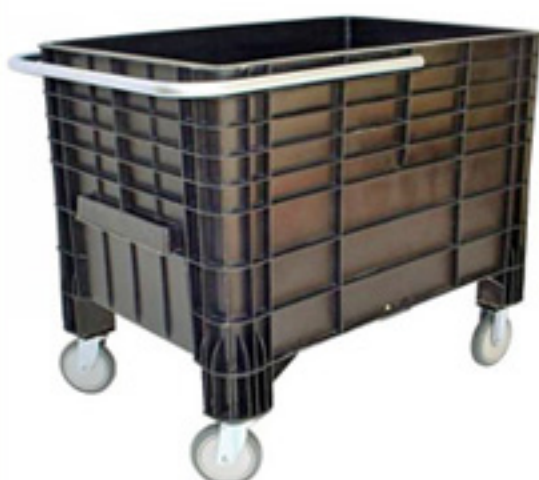
Cajón MAR con ruedas Medidas: 71 x 71 x 104 cm Capacidad 372 litros