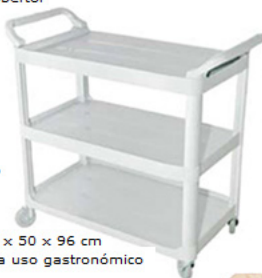
Carro utilitario transporte

EQUIPAMIENTO PARA USO HOTELERO MANTENIMIENTO Y LIMPIEZA