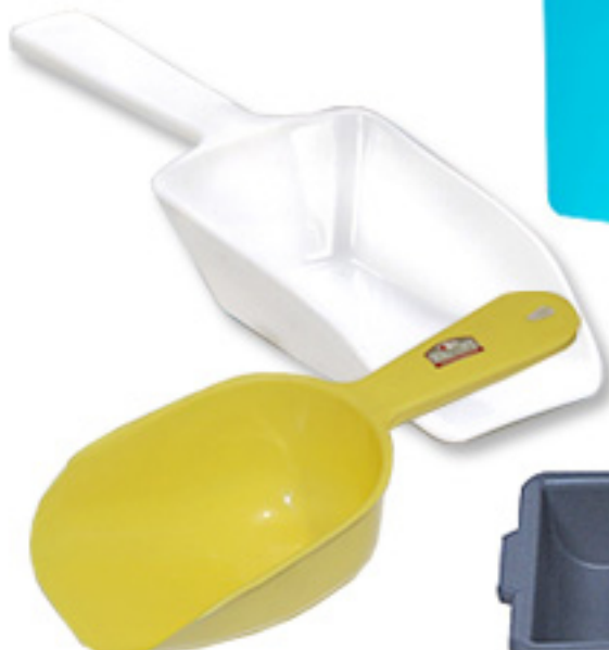
Cucharines plásticas en diferentes tamaños