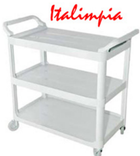
Carro CATERING 3800 - ITALIMPIA

Equipo 1000 es una división de La Casa de los Mil Envases S.A. Nuestra atención personalizada y asesoramiento profesional son la clave para la apertura, equipamiento integral y reposición de su emprendimiento hotelero y/o gastronómico.