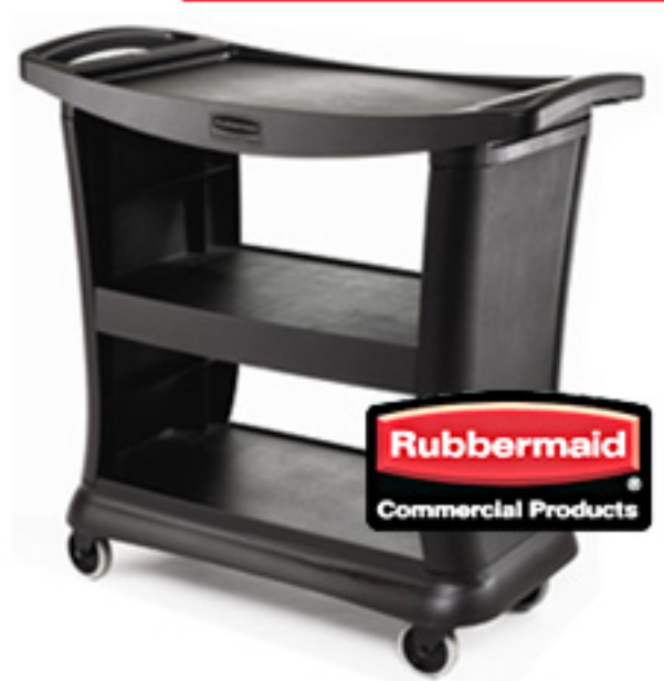
Carro 9T68 - Rubbermail EXECUTIVE SERVICE CART